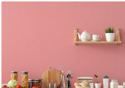
Nicht nur designstark, sondern auch mehrfach überstreichbar und kratzfest nach Anstrich: das Strukturvlies Basic.

bedruckte Variante mit CO 2 -Neutralität.