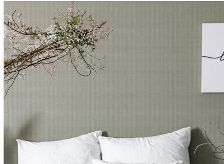
Die ausdrucksstarken Strukturen – wie hier Vliesfaser Protect – lassen Wände mit einzigartigem Charakter entstehen.

Erfurt-Strukturvlies Premium ist eine weiß bedruckte Strukturtapete, die auf einen ebenfalls