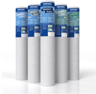
Das neu organisierte Sortiment ist in insgesamt fünf Teilbereiche unterteilt.

Erfurt-Strukturvlies Basic ist eine ausdrucksstarke Strukturtapete, die auf einem ökologischen Vliesträger aufgebracht ist. Die vielfältigen Ausführungen lassen moderne Wandbilder mit ausgeprägter, dreidimensionaler Wirkung entstehen. Möglich wird dieser überzeugende plastische Effekt durch den wasserbasierten, komplett PVC-