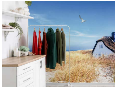
Die neue JuicyWalls Kollektion begeistert nicht nur mit zahlreichen stimmungsvollen Naturmotiven.

Wuppertal, Mai 2022 – (fpr) Digital bedruckte Tapeten liegen im Trend – immer mehr Menschen wie auch Unternehmen entdecken die fantastischen Möglichkeiten großformatiger Bildmotive zur kreativen Wandgestaltung oder als Corporate Design-Bestandteil. Erster Ansprechpartner bei der Auswahl und Anbringung einer Digitaldrucktapete ist der professionelle Maler. Von ihm wird inzwischen aber weit mehr als nur perfektes Handwerk erwartet. Gestalterische Beratung, Hilfe bei der Motivwahl sowie die Bestellabwicklung erweitern das Anforderungsprofil moderner Wandgestalter um neue Aufgaben. Unterstützung erhalten Malerprofis beim Tapetenhersteller Erfurt. Das Wuppertaler Familienunternehmen verfügt im Digitaldruck über große Erfahrung: Die bereits seit vielen Jahren etablierte JuicyWalls PRO Kollektion hat sich bei den Malern zur Referenz für anspruchsvolle Digitaldruckprojekte entwickelt.