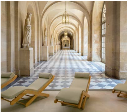
Die Motive der aktuellen JuicyWalls Kollektion eröffnen der Raumgestaltung völlig neue Perspektiven.

Hanz Tack Faupel Communication GmbH Phone: +49 211 74005 20 Fax: +49 211 74005 28 h.tack@faupel-communication.de