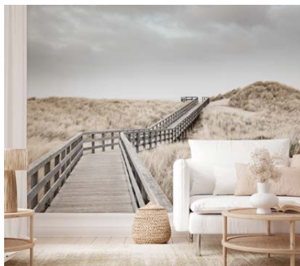
Wenn sich die Farben einer JuicyWalls Digitaldrucktapete im Interieur fortsetzen, entsteht im Raum eine atemberaubende Tiefe.

In der Kollektion „MeisterWände – Das beste auf Tapete“ präsentiert Erfurt eine Auswahl seiner Klassiker – hier finden sich die besten, schönsten und beliebtesten Motive der vergangenen acht Jahre. Die neue JuicyWalls PRO Kollektion gibt es ab sofort zur Ansicht unter www.erfurt.com/digitaldruckwaende – die umfassende Bildersammlung empfiehlt sich beispielsweise ideal als Inspirationsquelle für Beratungsgespräche. Noch einfacher kann die unglaubliche Vielfalt anhand der Kollektionsbücher gezeigt werden. Zudem ist das in der Sammelkollektion enthaltene Echtmusterbuch zum Fühlen und Begreifen der unterschiedlichen Tapeten und Strukturen ein hilfreiches Extra. Die Kollektion ist über den Fachgroßhandel oder den Erfurt-Außendienstmitarbeiter erhältlich.