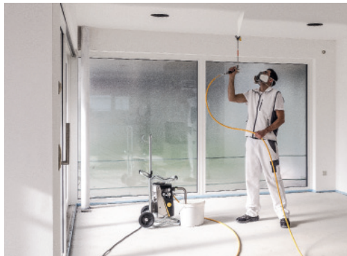
Das AIRLESS-Vlies ist speziell zur Gestaltung mit dem effizienten Beschichtungs-Verfahren entwickelt worden.

Wuppertal, April 2019 – (fp) Maler kennen das aus ihrer Berufspraxis: Bei der Beschichtung im Airless-Verfahren neigen herkömmliche Zellulose-Vliese zu aufgestellten Fasern, wodurch in der Oberfläche unschöne Knötchen entstehen. Die Folge: Es wird ein kostenintensives und zeitraubendes Nacharbeiten erforderlich, welches den eigentlichen Verarbeitungsvorteil wieder aufhebt. Genau hier setzt Erfurt & Sohn mit der Entwicklung seines neuen Variovlies AIRLESS an: Mit der Innovation können Profis die Beschichtung im Airless-Verfahren mit äußerst geringem Aufwand, sprich ohne mühsamen Zwischenschliff oder Nachrollen, durchführen – für maximale Effizienz und Wirtschaftlichkeit.