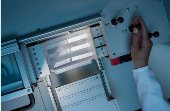
Rissfestigkeit, Körnung und Materialstärke: In der Qualitätskontrolle werden alle Produkte mit modernster Technologie kontrolliert.