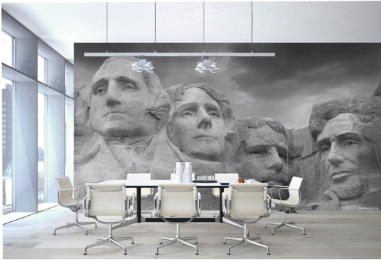
Nahezu jeder optische Gestaltungswunsch lässt sich mit den hochwertigen Digitaldrucktapeten von Erfurt realisieren.

Wuppertal, Dezember 2017 – (fpr) Ob im Job, im sozialen Umfeld oder beim Konsumverhalten: Nur wenig andere Begriffe umschreiben das Streben jedes Einzelnen nach Selbstbestimmung und Autonomie derart passend wie die aktuellen Megatrends „Individualisierung“ und „Personalisierung“. Ein großes Angebot an Gebrauchsgütern und Innovationen eröffnet