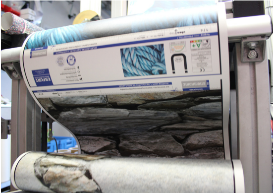
Die passgenaue Fertigung der Tapeten – wie hier im Tonerdruck – ermöglichen exzellente Ergebnisse an der Wand.

gebende Technologien sind verbrauchernah geworden und dank Smartphone und Digicam der breiten Masse zugänglich. Zudem nimmt die Zielgruppe der ‚Digital Natives‘ kontinuierlich zu. Aus dieser Entwicklung ist ein völlig neues Bewusstsein für stilbildende Motive entstanden, das auch die persönliche Vorstellung prägt, wie jeder Einzelne seine Geschäfts- oder Privaträume gestaltet sehen möchte. Und genau hier setzen wir mit unserer Kompetenz an.“