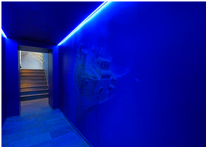
Gestochen scharfe Unterwasserwelt – der brillante Digitaldruck auf Erfurt-Vliestapete macht's möglich.

Einsatz weiterer, die Raumatmosphäre beeinflussender Elemente – wie z.B. Beleuchtung – geschickt kombiniert. Die Basis für die ganzheitliche Inszenierung der norddeutschen Aqualandschaften war somit geschaffen.