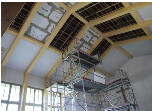
An der Decke wurden insgesamt etwa 150 m 2 der Innen-Dämmplatte KlimaTec IP 3500+ verbaut.

Mit ihrem Gemeindehaus steht die Heckinghauser Gemeinde vor der Herausforderung, die immer nur kurzzeitig genutzten Räume schnell auf eine angenehme und ausreichend warme Wohlfühltemperatur zu bringen. In Anbetracht des relativ geringen Energieaufwands der letzten Jahre war jedoch auch klar, dass sich eine Außendämmung von Fassade und Dach rein wirtschaftlich als nicht rentabel erweisen würde. Um vor diesem Hintergrund die richtigen Sanierungs-