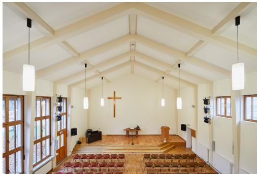
Nach der Sanierung des Kirchensaals in Wuppertal-Heckinghausen lässt sich der Raum schneller auf eine angenehme Wohlfühltemperatur bringen.

Wuppertal, März 2017 – (fpr) Kalt abstrahlende Wände und eine zu lange Erwärmungsphase des Saals – das waren die Hauptgründe, weshalb sich die Vereinigte Evangelische Kirchengemeinde in Wuppertal-Heckinghausen dazu entschloss, den Kirchenraum ihres Gemeindehauses zu sanieren. Planung und Durchführung fanden dabei in regem Austausch mit den Moderni-