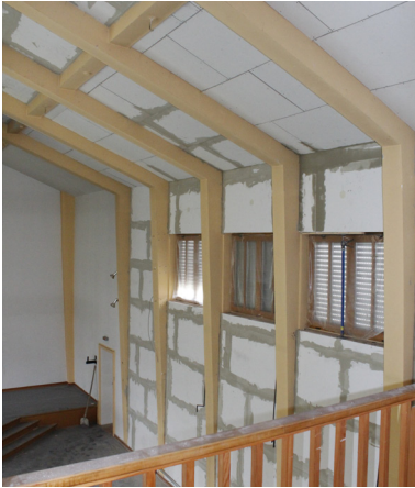
An dieser außenliegenden Wand war die abfallende Kälte früher spürbar.

Meike Worms Faupel Communication GmbH Phone: +49 211 74005 56 Fax: +49 211 74005 28 m.worms@faupel-pr.de