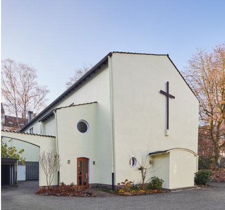
Das freut die Gemeinde: Die positiven Auswirkungen auf das Raumklima sind bereits kurz nach der Sanierung zu spüren.

auf ein perfektes Maß optimieren ließ.“ „Wir sind sehr glücklich über das Ergebnis“, resümiert Balke. „Dank der professionellen Beratung und Begleitung von Erfurt & Sohn verlief das gesamte Sanierungsprojekt reibungslos. Unser Renovierungsziel wurde damit absolut erreicht.“