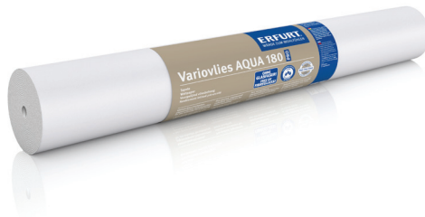
Erfurt-Variovlies AQUA 180

Schneidverhalten des Vlieses positiv bemerkbar. Erfurt-Variovlies AQUA 180 ist darüberhinaus reißfest, dimensionsstabil und rissüberbrückend. Dank der klar definierten Menge Trockenkleister ist auch die Verarbeitung an der Decke möglich. Das Ergebnis ist ein glatter, gleichmäßig saugender Untergrund, der durch die pigmentierte Oberfläche mit deutlich geringerem Farbverbrauch als üblich gestrichen werden kann. Zusammen mit der zeitsparenden Verarbeitung ist ein wirtschaftlicher Abschluss des Auftrags mit perfektem Ergebnis sicher.