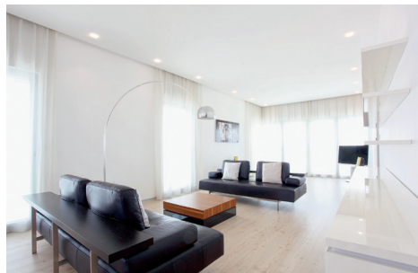
Das Zellulosevlies erspart dem Maler bei der Verarbeitung viele Arbeitsschritte.

Wuppertal, März 2016 – (fpr) Neben der Erzielung eines optisch einwandfreien Ergebnisses legt der professionelle Verarbeiter vor allem großen Wert auf die Wirtschaftlichkeit seiner Aufträge. Erfurt ermöglicht mit dem neuen Variovlies AQUA 180 eine zeitsparende und saubere Verarbeitung durch die Reduzierung von Arbeitsschritten und unterstützt den Maler dabei, effizienter und somit ökonomischer zu arbeiten. Darüberhinaus überzeugt das vorgekleisterte Zellulosevlies durch gesundheitliche Unbedenklichkeit und beste Produktqualität.