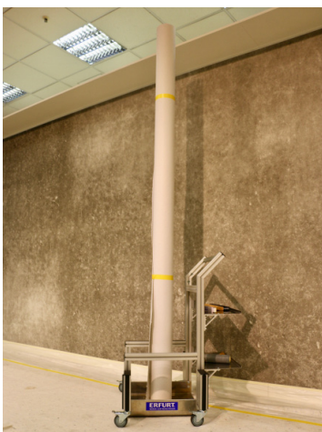
Raumhohes Tapezieren: mit der GIGA-Rolle und eigens entwickeltem Gestell.

Meike Worms Faupel Communication GmbH Phone: +49 211 74005 56 Fax: +49 211 74005 28 m.worms@faupel-pr.de